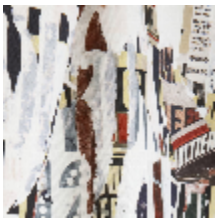
3472-01 METROPOLITAIN - NATUREL