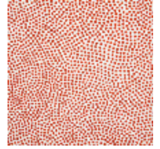
3473-06 ESCALE - BRIQUE