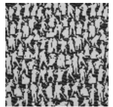
3492-06 SILHOUETTES - NOIR