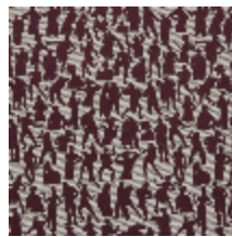
3492-04 SILHOUETTES - BORDEAUX