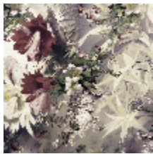
3497-01 FLOWER POWER - PASTEL