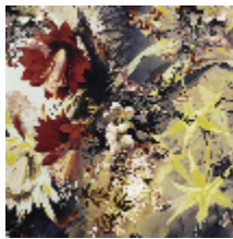
3497-02 FLOWER POWER - MORDORE