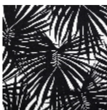
3505-02 TIKI - NOIR