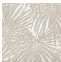
3505-01 TIKI - NATUREL