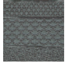
3614-06 PATCHWORK - ACQUA