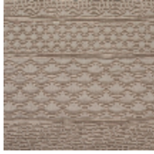
3614-02 PATCHWORK - TAUPE