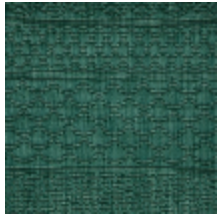
3614-07 PATCHWORK - PAON