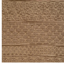
3614-03 PATCHWORK - CAMEL