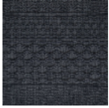
3614-01 PATCHWORK - FUSAIN