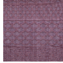
3614-05 PATCHWORK - LILAS