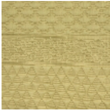
3614-08 PATCHWORK - LIMONCELLO