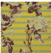
3615-02 CROISIÈRE - BERGAMOTE