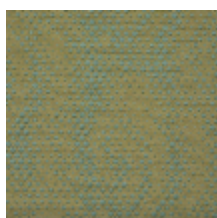
3619-01 TROIS D - BERGAMOTTE