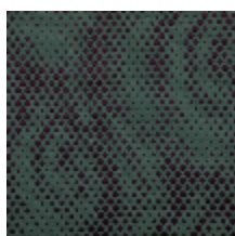
3619-02 TROIS D - ACQUA/PRUNE