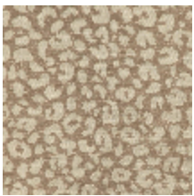
4031-01 FAUVE - PERLE