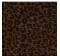
4031-06 FAUVE - CAMEL