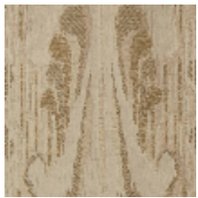
4032-01 SCULPTURE - NATUREL