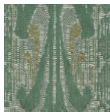
4032-04 SCULPTURE - CELADON