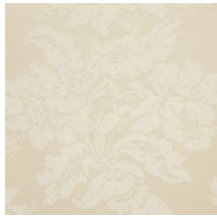
4237-01 VILLARCEAUX - IVOIRE