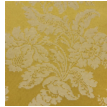
4237-05 VILLARCEAUX - OR