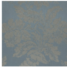
4237-03 VILLARCEAUX - POMPADOUR