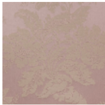
4237-07 VILLARCEAUX - POUDRE