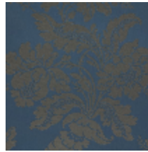
4237-04 VILLARCEAUX - NUIT