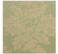
4237-06 VILLARCEAUX - AMANDE