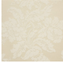
4237-01 VILLARCEAUX - IVOIRE