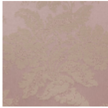
4237-07 VILLARCEAUX - POUDRE