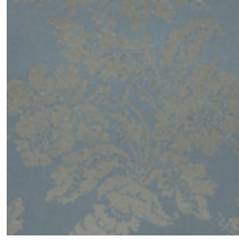
4237-03 VILLARCEAUX - POMPADOUR