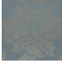
4237-03 VILLARCEAUX - POMPADOUR