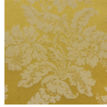
4237-05 VILLARCEAUX - OR