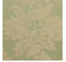
4237-06 VILLARCEAUX - AMANDE