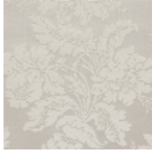
4237-02 VILLARCEAUX - ARGENT