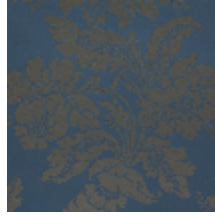
4237-04 VILLARCEAUX - NUIT