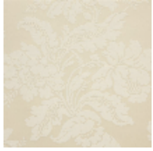
4237-01 VILLARCEAUX - IVOIRE