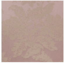
4237-07 VILLARCEAUX - POUDRE