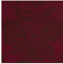
4237-08 VILLARCEAUX - RUBIS