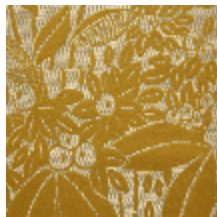
4241-03 VETIVER M1 - BERGAMOTE