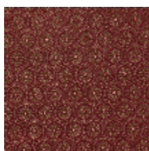
4243-01 MEDAILLON - CRAMOISI