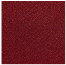
4244-01 BOSQUET - CRAMOISI