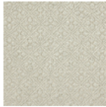
4244-04 BOSQUET - IVOIRE