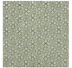
4244-06 BOSQUET - CELADON