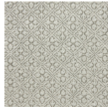
4244-05 BOSQUET - ARGENT