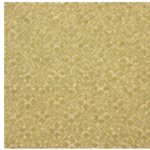
4244-03 BOSQUET - MORDORE