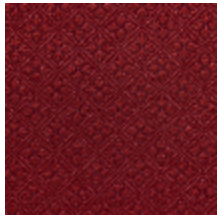
4244-01 BOSQUET - CRAMOISI