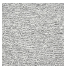
4246-03 ORÉE - PERLE