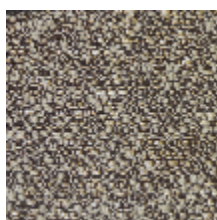
4246-01 ORÉE - LIEGE