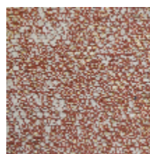
4246-06 ORÉE - LAVE