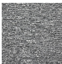
4246-02 ORÉE - GRANIT