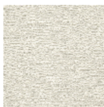
4246-04 ORÉE - PLATRE