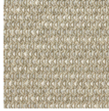
4248-04 DIAMANT - MICA