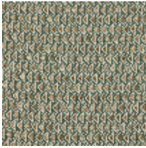
4248-08 DIAMANT - JADE