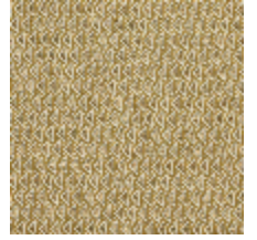
4248-06 DIAMANT - OR