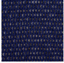
4248-01 DIAMANT - LAPIS