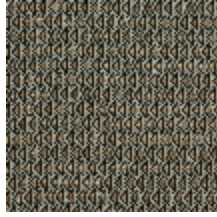
4248-03 DIAMANT - GRAPHITE