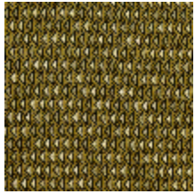
4248-07 DIAMANT - SOUFRE