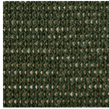
4248-09 DIAMANT - SERAPHINITE