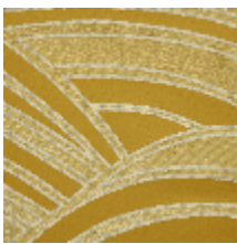
4250-02 DUOMO M1 - OCRE