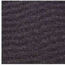
4251-08 KATMANDOU - AUBERGINE