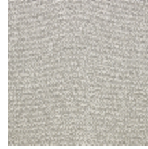
4251-05 KATMANDOU - FICELLE