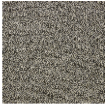
4251-07 KATMANDOU - LIEGE