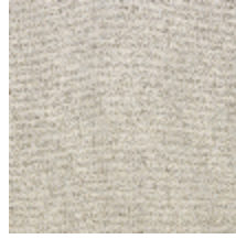
4251-04 KATMANDOU - NATUREL