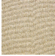
4251-03 KATMANDOU - GENÊT