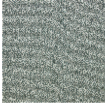
4251-02 KATMANDOU - EUCALYPTUS