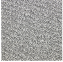
4251-01 KATMANDOU - GRANIT