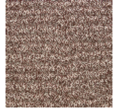
4251-06 KATMANDOU - TOMETTE