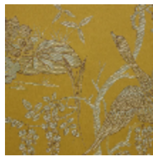
4253-04 LA PARADE DES OISEAUX-OR