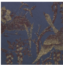
4253-02 LA PARADE DES OISEAUX-ORAGE