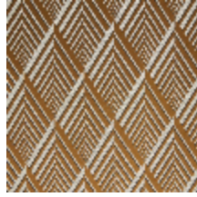
4256-04 ARIANE M1 - GAZELLE