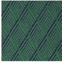
4256-07 ARIANE M1 - MENTHE