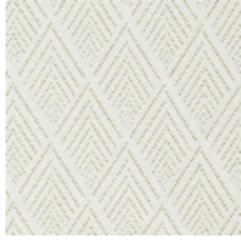
4256-01 ARIANE M1 - BLANC