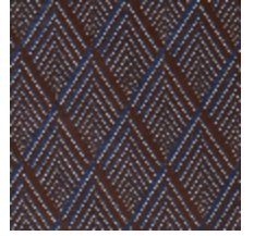
4256-06 ARIANE M1 - CHOCOLAT