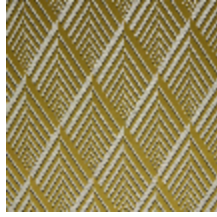
4256-03 ARIANE M1 - ABSINTHE