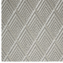
4256-02 ARIANE M1 - NATUREL