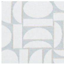
4260-02 FJORD - GLACIER