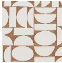
4260-04 FJORD - COGNAC