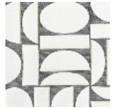
4260-06 FJORD - POIVRE