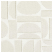
4260-01 FJORD - ECRU