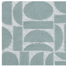
4260-03 FJORD - CELADON