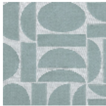
4260-03 FJORD - CELADON