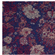
4261-05 FELICITÉ - ENCRE