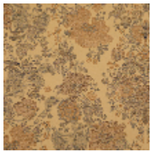
4261-01 FELICITÉ - DORÉ