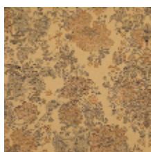
4261-01 FELICITÉ - DORÉ