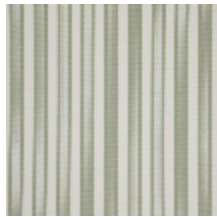
4264-09 HOULGATE - TILLEUL