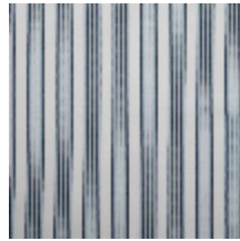
4264-04 HOULGATE - OPALE