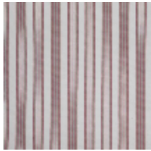
4264-01 HOULGATE - BOUDOIR