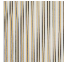
4264-12 HOULGATE - PAILLE