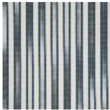
4264-08 HOULGATE - BUIS