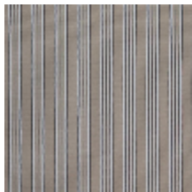
4264-13 HOULGATE - FICELLE