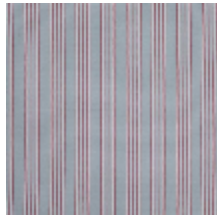
4264-03 HOULGATE - PORCELAIN