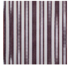
4264-06 HOULGATE - CHILIENNE