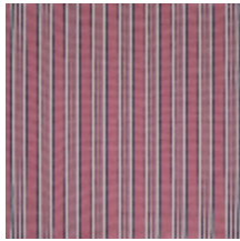
4264-02 HOULGATE - ROSE