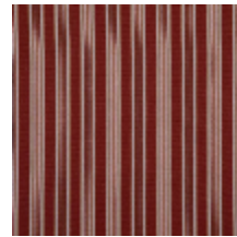
4264-11 HOULGATE - TERRE CUITE