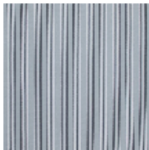
4264-14 HOULGATE - PERLE