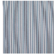
4264-05 HOULGATE - FAIENCE