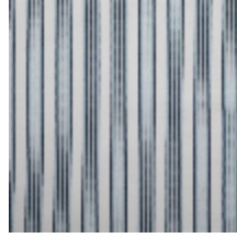
4264-04 HOULGATE - OPALE