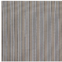
4264-13 HOULGATE - FICELLE