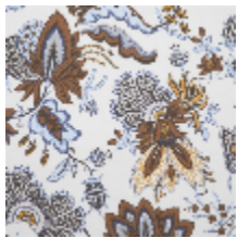
4266-01 EGLANTINE - NATUREL