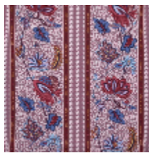
4267-03 AUGUSTINE - GRIOTTE