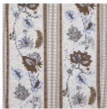
4267-01 AUGUSTINE - NATUREL