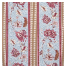
4267-04 AUGUSTINE - BOUDOIR