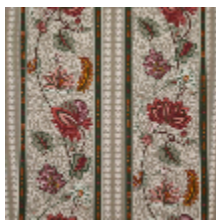
4267-02 AUGUSTINE - PRINTEMPS