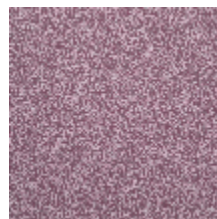
4268-05 LEONTINE - BOIS DE ROSE