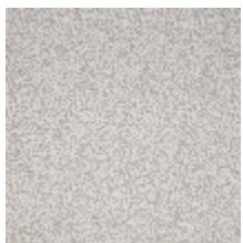
4268-01 LEONTINE - NATUREL