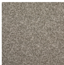
4268-03 LEONTINE - KAKI