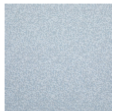
4268-06 LEONTINE - CIEL