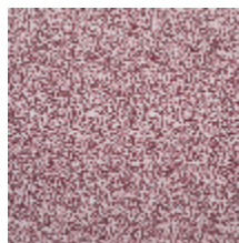
4268-04 LEONTINE - GRIOTTE