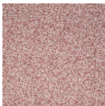
4268-02 LEONTINE - TOMETTE