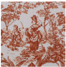
4269-01 BELLE SAISON - TERRACOTTA