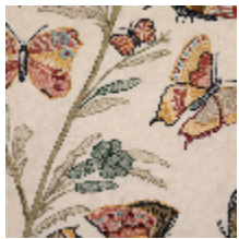
4270-01 FLANERIE - PRINTEMPS