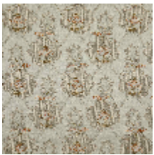
4281-01 OMBELLE - NATUREL