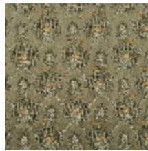
4281-04 OMBELLE - KAKI