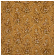
4281-02 OMBELLE - MORDORE