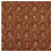
4281-03 OMBELLE - SIENNE