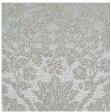
4282-01 RECITAL - ECRU