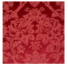
4282-06 RECITAL - RUBIS