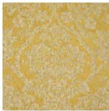
4282-02 RECITAL - DORE