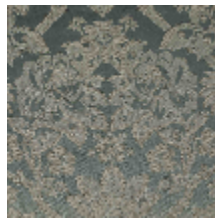
4282-04 RECITAL - NATTIER