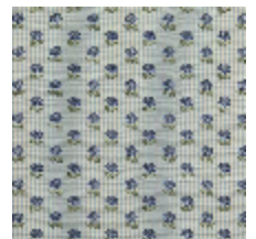
4283-06 EXQUISE - NATTIER