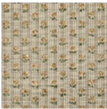
4283-01 EXQUISE - BEIGE