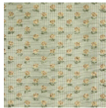
4283-03 EXQUISE - AMANDE