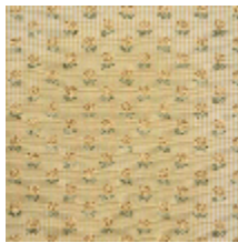
4283-02 EXQUISE - DORE