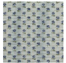
4283-06 EXQUISE - NATTIER