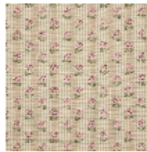
4283-04 EXQUISE - PETALE