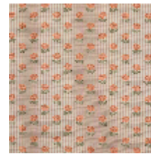
4283-05 EXQUISE - CAPUCINE