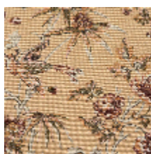
4287-02 COQUETTE - FLEUR D'ORANGER