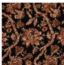
4288-03 POEME - NOIR