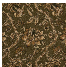
4288-02 POEME - KAKI