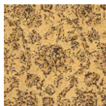
4288-01 POEME - DORE