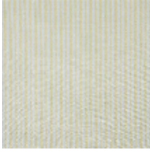
4290-02 COMTESSE - JONQUILLE