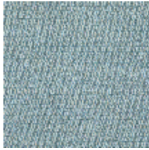
5056-08 ANTIGUA - AZUR