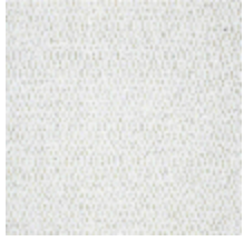
5056-01 ANTIGUA - NATUREL