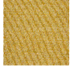
5056-06 ANTIGUA - SOLEIL