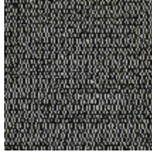
5056-03 ANTIGUA - NOIR