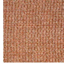
5056-05 ANTIGUA - TOMETTE