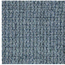
5056-09 ANTIGUA - OCEAN