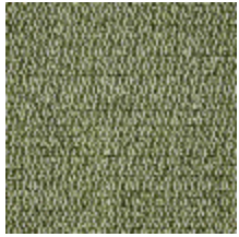
5056-07 ANTIGUA - KAKI