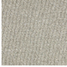
5056-02 ANTIGUA - FICELLE