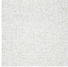
5056-01 ANTIGUA - NATUREL