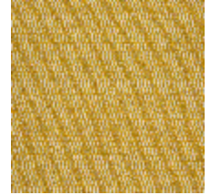
5056-06 ANTIGUA - SOLEIL