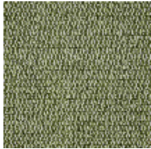
5056-07 ANTIGUA - KAKI