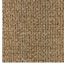
5056-04 ANTIGUA - BRONZE