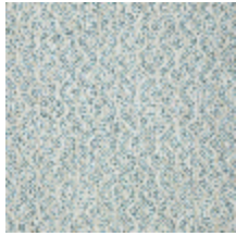
5057-07 SOMBREIRO - AZUR