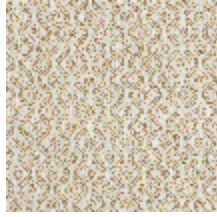
5057-03 SOMBREIRO - BRONZE