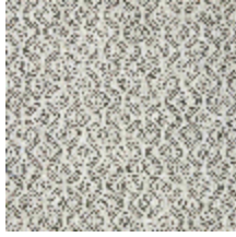
5057-02 SOMBREIRO - POIVRE