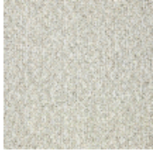
5057-01 SOMBREIRO - NATUREL