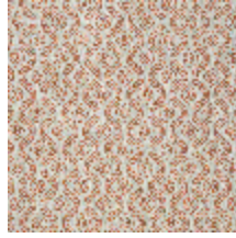
5057-04 SOMBREIRO - TOMETTE