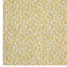
5057-05 SOMBREIRO - SOLEIL