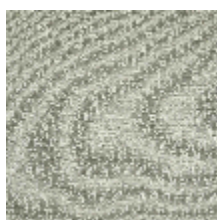
5067-01 AMARRE - ARGILE