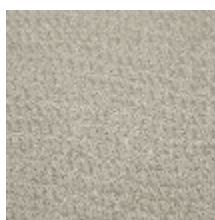
5067-02 AMARRE - NATUREL