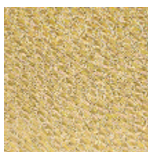
5067-03 AMARRE - DORE