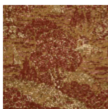
5068-02 LA TRAVERSEE - CUIVRE